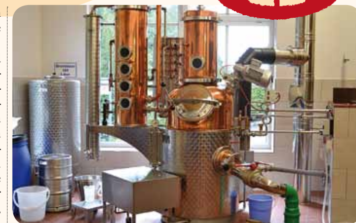
Das hochmoderne Brenngerät kommt in dem Anbau erst richtig schön zur Geltung.