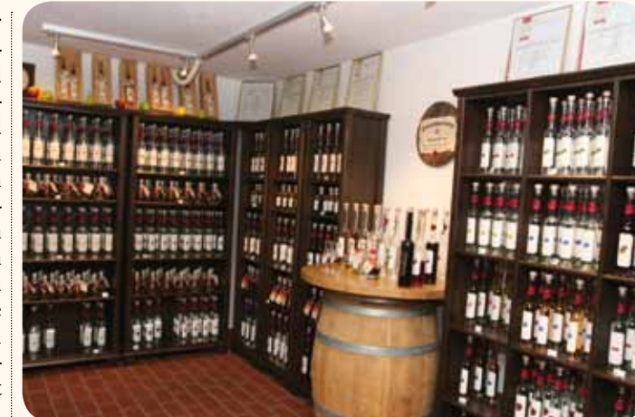
Aus der ehemaligen Brennerei ist ein liebevoll eingerichteter Verkaufsraum geworden.